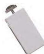
Obj. č. 950750